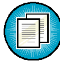
Nouveaux papier Journal