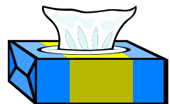
Nouveau papier sanitaire et domestique